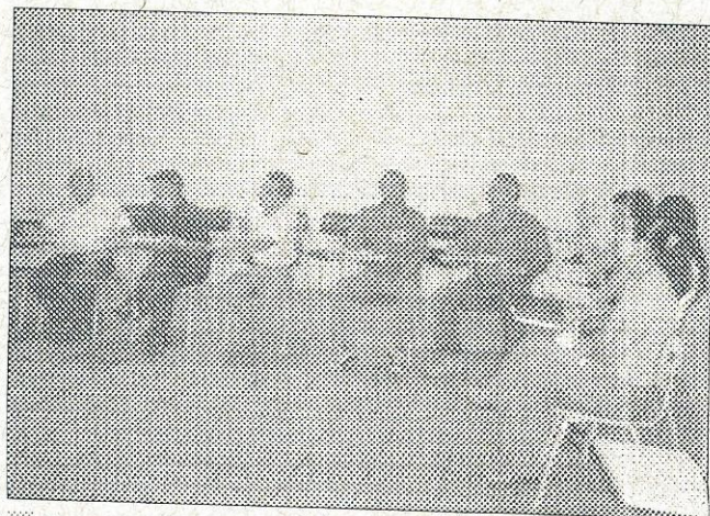
Os representantes das entidades assistiram atentamente a apresentação da proposta.