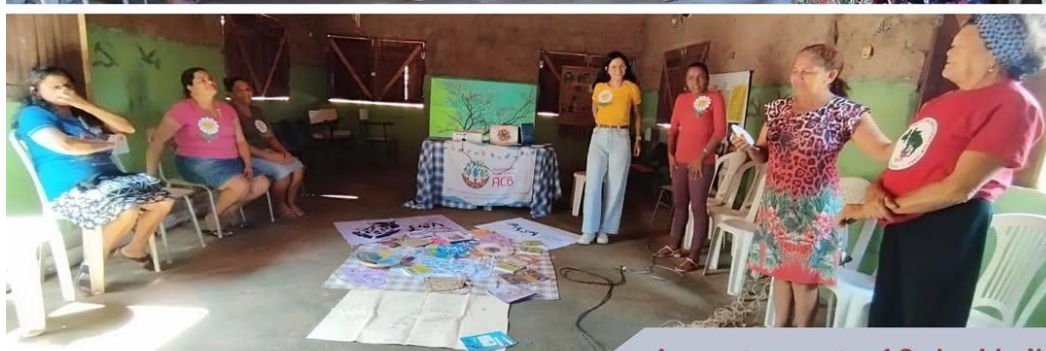
Assentamento 10 de Abril